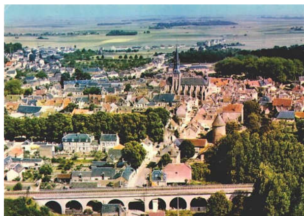
documents© les Amis de Bonneval

Le château d'eau actuel ne sera en mesure que d'alimenter la partie de la nouvelle cité la plus proche de la ville, celle qui se trouve en bordure de la route de Sancheville. Pour l'autre partie, il faudra construire une autre installation. Mais l'approvisionnement en eau va s'avérer vraisemblablement insuffisant et il est fortement question de rechercher sous terre l'eau nécessaire dans les alluvions du Loir. Importants travaux en perspective, comme on le voit ... De même, un nouveau réseau d'égouts devra venir se raccorder sur le réseau actuel, et la construction d'une station d'épuration devra