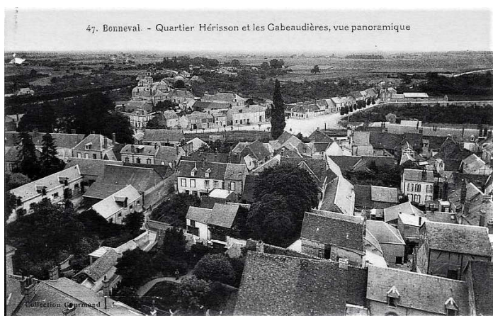
Bonneval : quartier Hérisson et les Gabeaudières