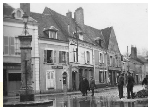
Inondations 1941